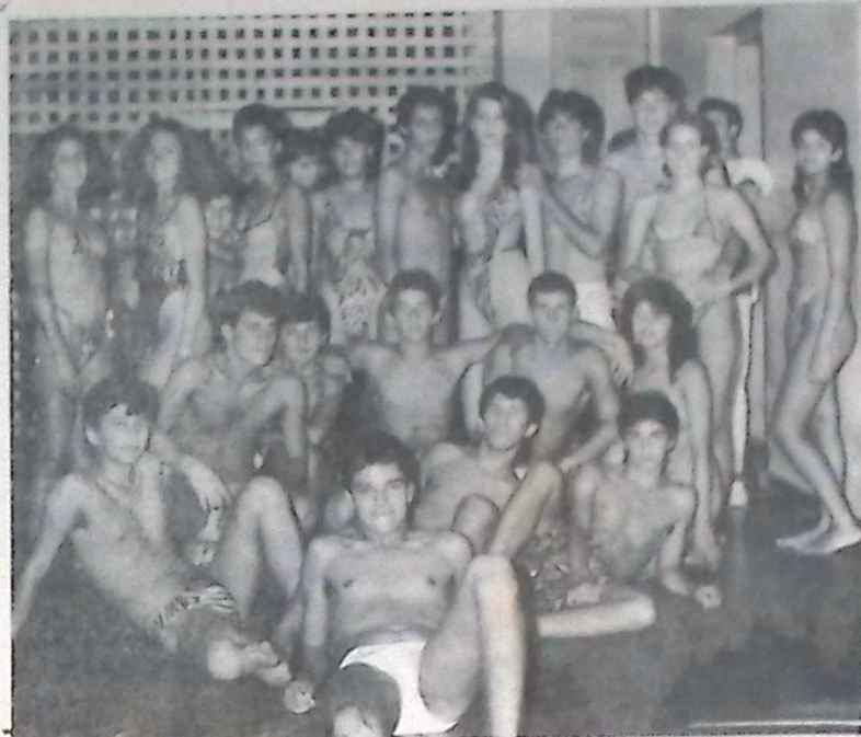
PARTICIPANTES DO CONCURSO

Muita, mas muita gente mesmo pintou no Grêmio para prestigiar e se deliciar com o bonito visual proporcionado pelo desfile das Gatas e Garotos que correram ao Título de Garoto/Garota Verão 86, promovido pelo Grêmio Pedro Rufino, que neste final de ano está com a bola toda.