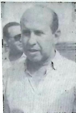
GOVERNADOR MARCELO MIRANDA

O Governador do Estado, Marcelo Miranda Soares, após uma reunião com a Comissão Executiva Regional do PMDB e secretários de Estado, informou que todos os servidores públicos estaduais estarão recebendo nesta sexta-feira, dia 08, os salários referentes ao mês de novembro. Também alguns pagamentos do mês de dezembro já estão sendo feitos, os Tribunais de Justiça e de Contas, Assembleia Legislativa e Procuradoria Geral de Justiça já receberam esses pagamentos.