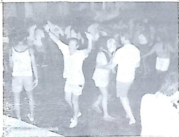
Flagrantes de foliões animadíssimos na 12ª noite de Carnaval no Grêmio Pedro Rufino! A Festa do Rei Momo promete "esquentar" lá no Grêmio. Muito suor, muito samba, muita alegria é o que todos esperam!