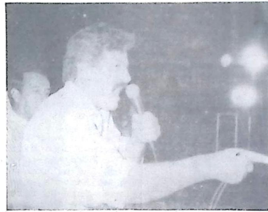
Deputado Oscar Goldoni

Oscar Goldoni foi absolvido de ação penal, montada através de 11 processos, acusando-o de contrabandista, formador de quadrilhas e falsida-