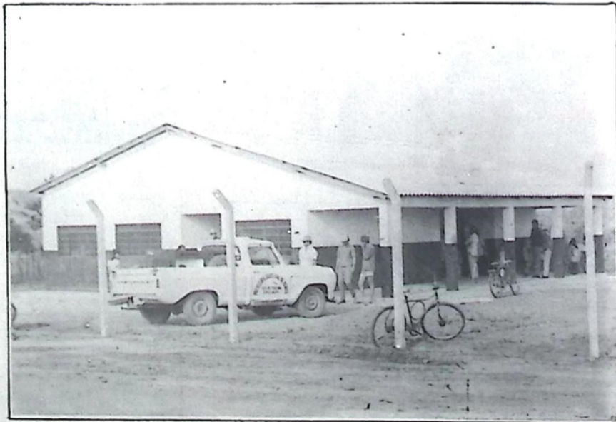
Na Escola recém construída por "Mimito" funcionou o "Quartel General" das operações e o Mutirão foi um sucesso