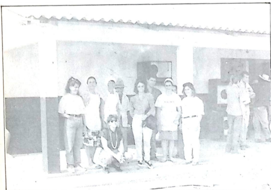
As merendeiras cozinharam o dia todo e todos que estavam na fila para serem atendidos tomaram refeição no local. Na foto aparece as merendeiras e demais funcionários da Prefeitura