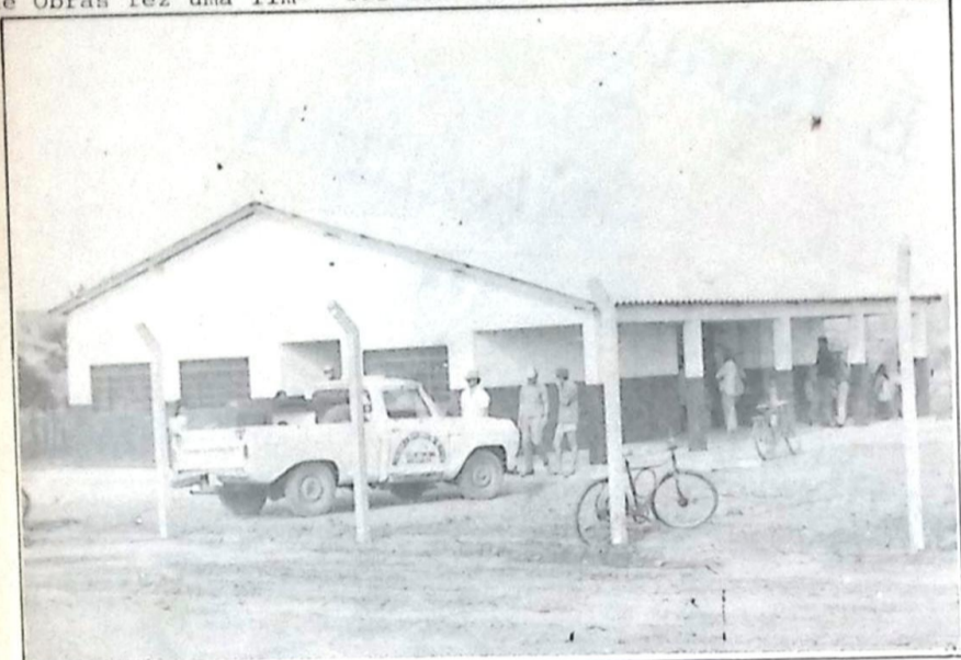
Na Escola recém construída por "Mimito" funcionou o "Quartel General" das operações e o Mutirão foi um sucesso

moradores. O mutirão da Vila Marambaia foi um verdadeiro sucesso, à exemplo de outro que há poucos meses foi levado à efeito na Vila Machado.