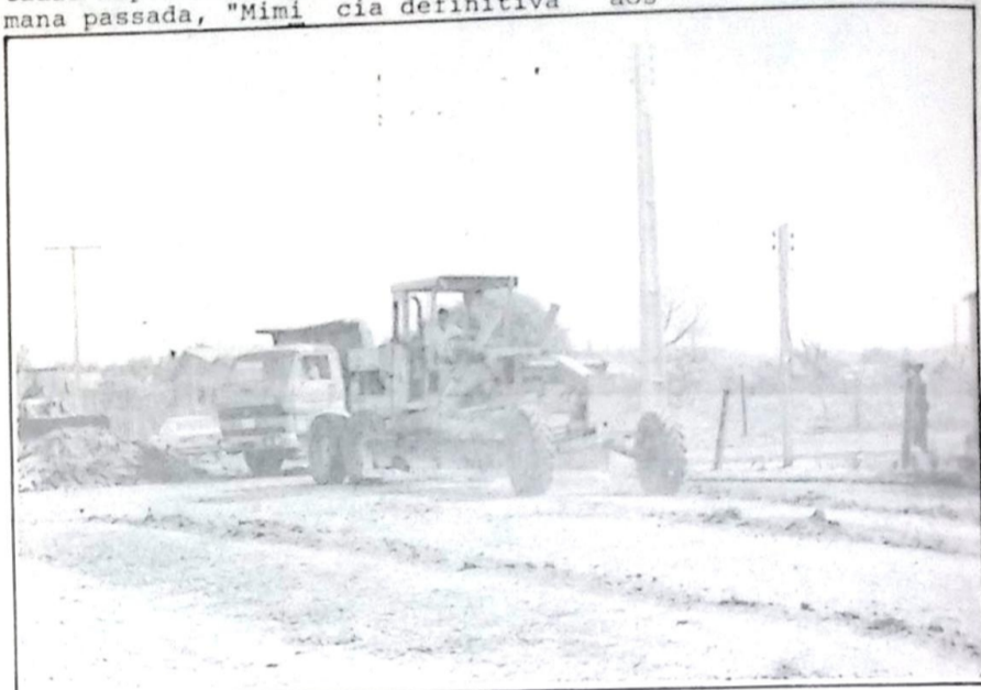
Toda a frota da Secretaria Municipal de Obras foi mobilizada, realizando limpeza em regra e patrulamento de todas as ruas