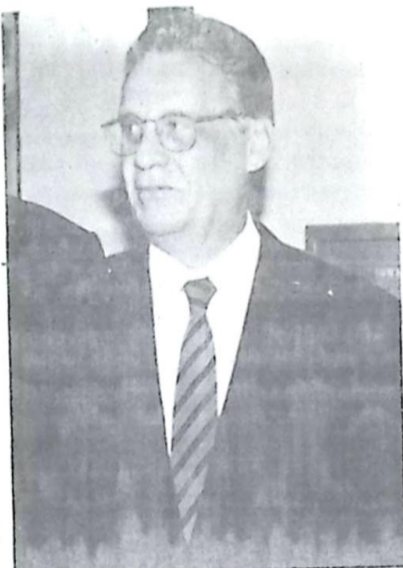
Fernando Henrique Cardoso Presidente da República

Com a aprovação da emenda da reeleição tudo torna-se mais fácil, já que muitos