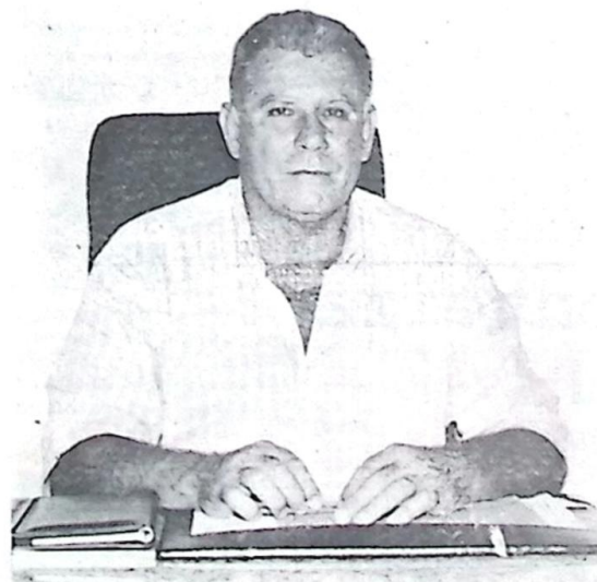
Garibaldi, Isenção aos inadimplentes até 96 e Desconto de até 60% no IPTU deste ano

Ressaltamos que nos valores do IPTU 97 lançados nos carnês, que se encontram a disposição dos contribuintes no setor de tributação da Prefeitura Municipal, já estão imbutidos os descontos de 50%, sobre os quais devem ser aplicados mais 10% de desconto para os contribuintes que optarem pelo pagamento à vista, até dia 05 de março. Quem optar pelo pagamento parcelado poderá pagar o Imposto em quatro parcelas, sendo também o dia 05 de