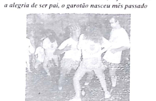
E quem falou que em Bela Vista não se sabe dançar a "dança da garrafa". Vejam só...