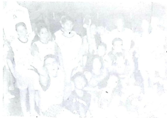
O animado Bloco, "Na Boquinha da Garrafa", sucesso estrondoso em todo o Brasil (a música e a dança) e sucesso em Bela Vista... o Bloco