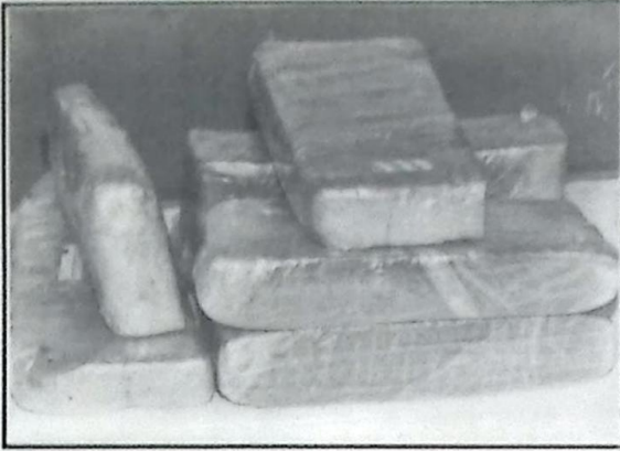
Na foto a considerável quantidade de maconha apreendida pela PM

Na última terça-feira, dia 04/03, por volta das 23:15 horas, ao realizarem revistas de rotina nas bagagens embarcadas no ônibus noturno que faz a linha Bela Vista/Campo Grande, estacionado na estação rodoviária, policiais militares encontraram aproximadamente 09 quilos de maconha prensada e embalada em pacotes com pouco mais de 1 quilo cada, acondicionada em uma caixa de papelão em meio a "coquitos", erva mate e produtos para confecção de bolo, utilizados para despistar a fiscalização e eliminar o cheiro da "erva".