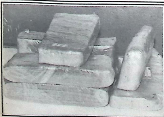
Na foto considerável quantidade de "maconha" apreendida pela PM