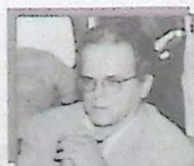
Luiz Carlos Mendonça de Barros Pres. do BNDEx

A Reforma do Estado é um problema do Brasil de hoje. O Real mexe com estruturas e vícios da máquina pública que precisam ser enfrentados com decisão. A folha de pagamentos de MS tem um crescimento vegetativo de 12% ao ano, ou seja, cresce 12% sem nenhum reajuste. Se a arrecadação aumenta 4%, temos aí um problema a ser resolvido imediatamente para dar ao Governo o dinamismo que ele precisa.