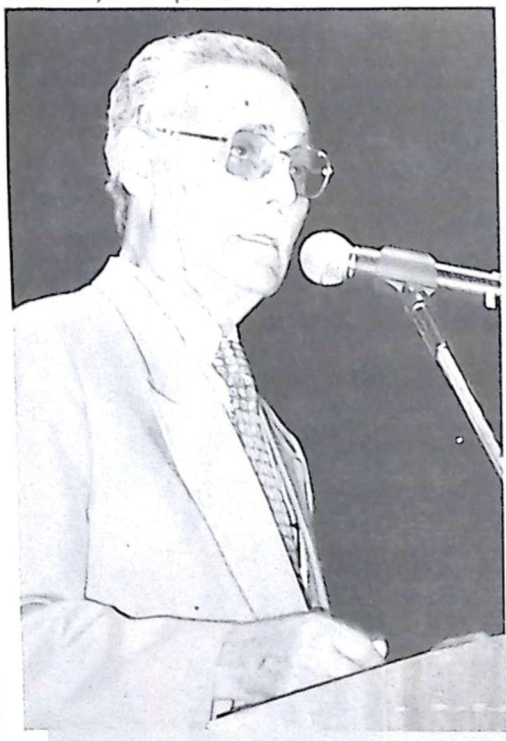
O governador Wilson Martins disse que o Estado atravessa momento dos mais difíceis da sua história.