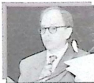
Pedro Parente Sec. Executivo do Ministério da Fazenda

Mato Grosso do Sul precisa do ajuste. Se ele não for feito agora, terá que ser feito mais tarde a um custo muito maior. O Brasil todo está se adaptando à economia estabilizada. Mato Grosso do Sul não é exceção. Tomou a decisão política e adotou medidas concretas e terá todo o apoio e cooperação do Governo Federal.