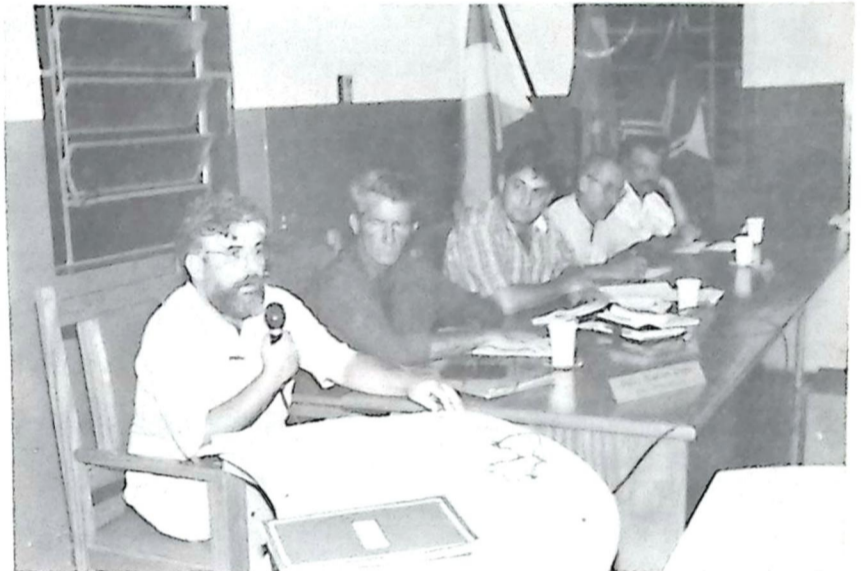
Na foto ao lado, o Secretário Municipal de Saúde em seus esclarecimentos na Câmara

Na próxima Edição, a cobertura completa sobre os esclarecimentos do Vice-Prefeito e Secretário Municipal de Saúde, na Câmara Municipal.