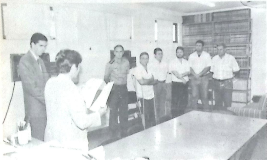
Registro de Solenidade de posse do Promotor no Gabinete da Juíza de Direito