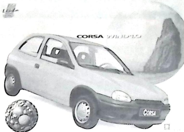
Este Corsa 0 Km está esperando por você no Festival de Prêmios do Belavistense

Ressaltamos que graças ao sistema de computador a ser utilizado na realização desse Festival de Prêmios, o sorteio dos números se dará de forma totalmente confiável, a exemplo de outras promoções do gênero já realizadas pelo Clube Esportivo Belavistense e Clube Codiga. Os casos em que duas ou mais cartelas forem premiadas ao mesmo tempo, serão decididos pela pedra maior, desde que na hora não haja um acordo entre os proprietários das respectivas cartelas ganhadoras. Lembramos também que as cartelas que por ventura não forem vendidas até a data do Festival de Prêmios, serão