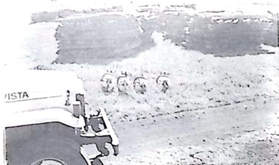
Na foto moto-serras e parte da aroeira apreendida pela Florestal

Em diligências na região da grande Dourados, que também faz parte da sua área de atuação, a Polícia Militar Florestal de Bela Vista, confirmando denúncias recebidas, flagrou a exploração ilegal de produtos florestais na Fazenda Santa Alaide, de propriedade do pecuarista Elio Côrrea de Assunção, localizada no Município de Itaun, efetuando a apreensão de mais de 10.000 (dez mil) lascas de aroeira (postes) que estavam depositadas na sede da fazenda, prontas para a comercialização. Página - 03