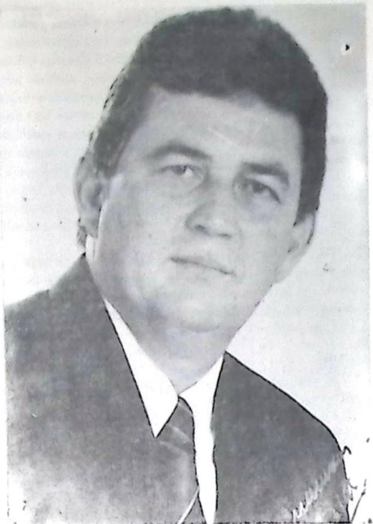
Deputado Waldemir Moka

O Deputado Estadual Waldemir Moka defendeu esta semana na Assembleia Legislativa o envolvimento da sociedade, através de seus segmentos organizados na discussão da crise econômica que afeta o Estado, no encaminhamento nas soluções e na formulação conjunta com o Governo Estadual de um programa de desenvolvimento para as próximas duas ou três décadas, gerando assim uma diretriz mais ampla e segura para a modernização, elevação da capacidade produtiva e aumento da geração de empregos do Mato Grosso do Sul.