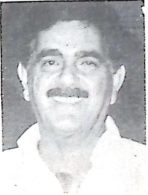
Ex-Governador Pedro Pedrossian

trabalha intensamente em torno do Nome do ex-governador Pedro Pedrossian para viabilizar sua volta em 98 e as alianças partidárias já se formam para dar a sustentação. Em recente visita à Guia Lopes, Nioaque e Miranda, bases eleitorais do ex-governador, Arroyo expôs a estratégia de costurar alianças e disse que Pedro Pedrossian conta com o desgaste do Governo do PMDB, um aliado para atrair as legendas que hoje estão recalitrantes em apoiar o Governo.