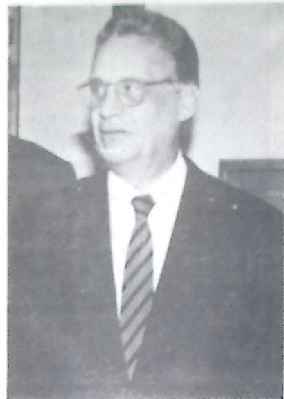
Presidente da República Fernando Henrique Cardoso

"Espero que o Congresso tenha o equilíbrio, como tem tido, de separar o joio do trigo. A questão das reformas administrativa e previdenciária, e outras Leis de grande significado que lá estão, dizem respeito ao povo brasileiro e não devem estar sujeitas a oscilação em função de comportamentos desabonadores eventuais de algum membro do Congresso ou de qualquer outro Poder. O Governo já fez tudo que podia (pela votação das reformas), a reforma é moderada, mas o Congresso tem de assumir suas responsabilidades. O Governo tem de pressionar, mas quando pressionam gritam, porque ficam lá alguns parlamentares querendo isso e aquilo. E se o Governo entra nesse jogo