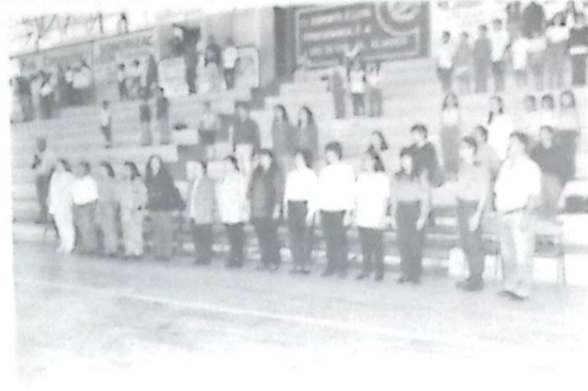
Um registro das autoridades e educadores que prestigiaram a abertura do Projeto "Esporte Solidário"

Nas fotos abaixo, flagrantes da solenidade de abertura do Projeto "Esporte Solidário" em nossa cidade