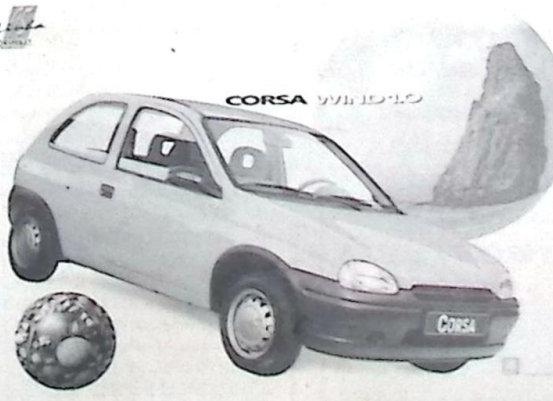
O veículo 0 Km será sorteado neste domingo

O Presidente do Clube Belavistense também informou que ainda existem cartelas a venda, os interessados devem procurar a Farmácia Moderna, na Rua Sebastião Crispim do Rego, centro da cidade. Quatro antenas parabólicas, um freezer vertical, um aparelho de som, uma mobilete, 1 TV 14 Polegadas e 1 veículo Corsa Zero quilômetro estão esperando por você no Festival de Prêmios do Clube Esportivo Belavistense.