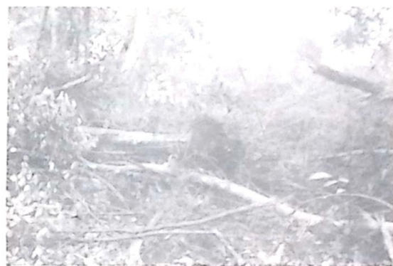
O Desmatamento irregular atingiu cerca de 100 Has da propriedade

De acordo com as informações levantadas pela Guarnição da Polícia Militar Florestal que flagrou o desmatamento ilegal, estava previsto o desmate de aproximadamente 180 has na Fazenda Estero Grande, o capataz alegou que os proprietários estavam providenciando o encaminhamento da documentação para a SEMADES/MS, porém, a Lei determina que a Licença Ambiental para a realização de desmatamento deve ser apresentada à autoridade competente no ato da Fiscalização.