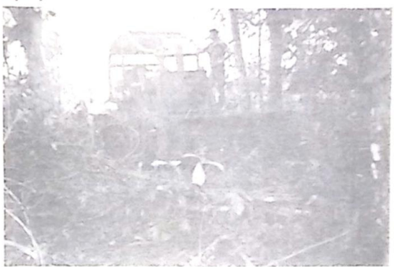
Um das máquinas de esteira apreendidas pela Florestal