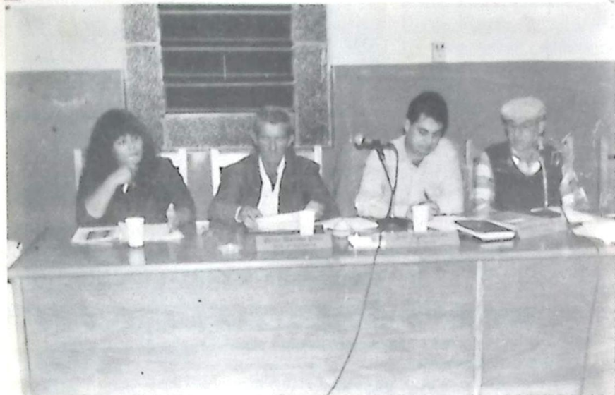
A Secretária respondeu a diversas perguntas formuladas pelos Vereadores, sobre diversos assuntos relacionados a sua pasta