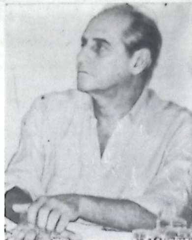
Senador Ramez Tebet

Em aparte, o Senador Júlio Campos (PFL-MT) concordou que a emenda da reeleição não prevê a desincompatibilização e sugeriu a elaboração urgente de uma nova