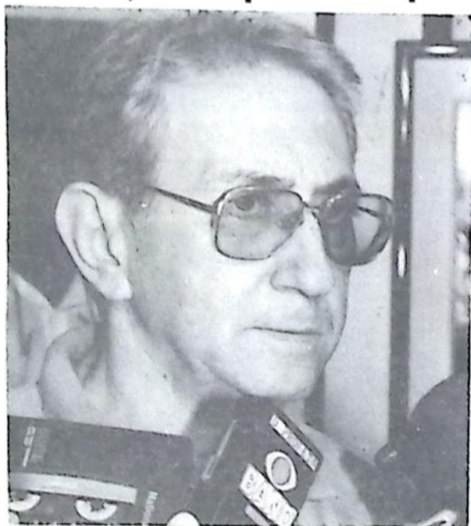
Deputado Estadual Roberto Orro

A Arara-Associação Recriativa dos Amigos Reais de Aquidauana, com o apoio do Gabinete do deputado Roberto Orro (PSDB), realiza no dia 20 de junho, às 22:30 horas, no Tunel Club, em Campo Grande, uma grande festa de confraternização: NOITE DOS ANOS DOURADOS.