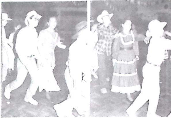
Flagrantes das apresentações da Quadrilha no Iº IEBV FEST

a realização do acontecimento, começaram as mais variadas apresentações, que contaram com a apresentação dos alunos do Paraguai, dançando galopeira e chupim, demonstrando total organização e disciplina exemplar, intercalando as danças com belíssimas alunas de Jardim, que apresentaram como se dança um bolero, também não esqueceram de lembrar que o trevo faz parte de nossas tradições.