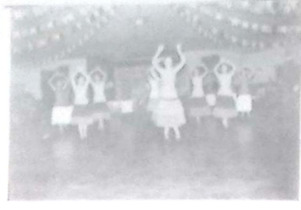
Um flagrante da apresentação do CEAJ

O Instituto de Educação de Bela Vista - 1º e 2º Graus, demonstrou neste último dia 30 de maio de 1997, mais uma vez, sua capacidade de melhor trabalho em Equipe, uma vontade clara que foi bem organizada, com objetivos bem definidos, não se esquivou à ação, não foge à luta; antes pelo contrário o desejo foi fortalecido, contando com as mais diversas apresentações, todas merecedoras de nossos eternos agradecimentos.