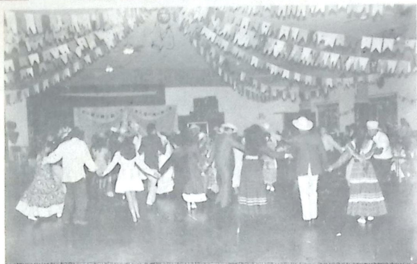
Um close das apresentações da quadrilha

O Instituto de Educação de Bela Vista - 1º e 2º Graus, demonstrou neste último dia 30 de maio de 1997, mais uma vez, sua capacidade de melhor trabalho em Equipe, uma vontade clara que foi bem organizada, com objetivos bem definidos, não se esquivou à ação, não foge à luta; antes pelo contrário o desejo foi fortalecido, contando com as mais diversas apresentações, todas mercedoras de nossos eternos agradecimentos. Página/06