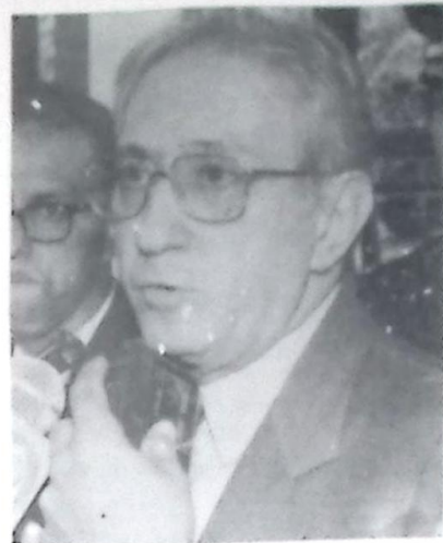
Deputado Roberto Orro

"Existe uma grande preocupação com relação à viabilização do funcionamento da máquina pública. Bens de utilidade questionáveis serão vendidos, servidores irão pedir demissão através do PDV, enfim, são medidas que visam solucionar os problemas do Estado da forma mais