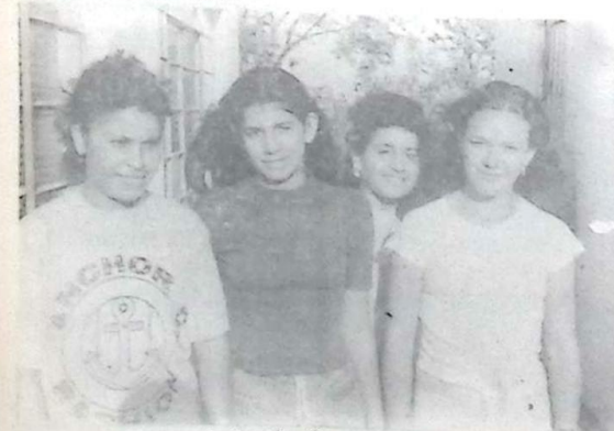
A juventude do Alto Caracol marcou presença