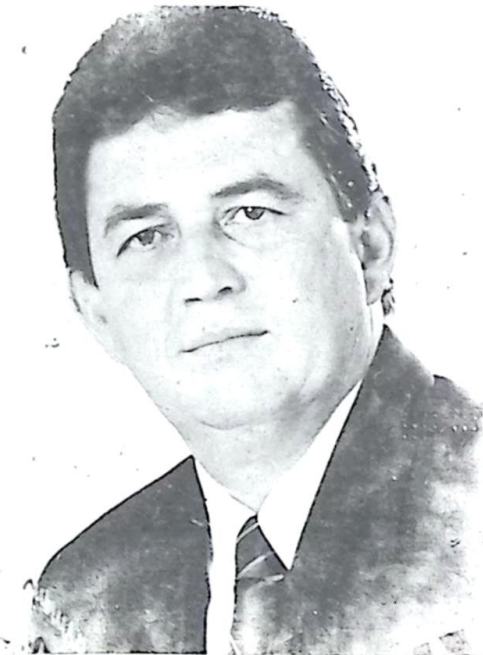
Deputado Estadual Waldemir Moka

"É a exigência do cidadão e sua capacidade de gerar pressão coletiva que promove as mudanças capazes de garantir a proteção ambiental", afirmou o deputado Waldemir Moka, primeiro Secretário da Assembleia Legislativa, ao falar em nome do Poder no 1º Seminário sobre Gestão dos Recursos Hídricos da bacia hidrográfica do rio Taquari, em Coxim.