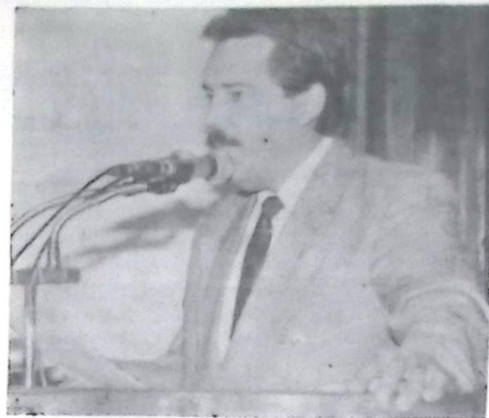
Deputado Antonio Carlos Arroyo

A Câmara Municipal de Caracol solicita a ampliação da rede de distribuição para as regiões do Bacurí e chácaras localizadas nos arredores da madeireira. com esta ampliação, serão beneficiadas aproximadamente quarenta pequenas propriedades produtivas, que só podem ter desenvolvimento pleno, contando com a energia elétrica, através de indicação, o Deputado Antonio Carlos Arroyo (PTB) já solicitou as providências junto à Enersul.