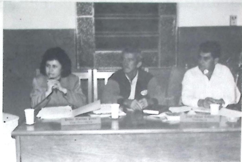
A Secretária respondeu à inúmeras perguntas formuladas pelos Vereadores

"Qual é o valor da dívida empenhada e não paga da atual administração? e quanto