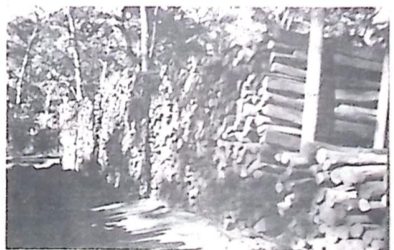
Nas fotos, flagrantes da grande quantidade de madeira apreendida pela Polícia Florestal na Fazenda Santo Antonio)