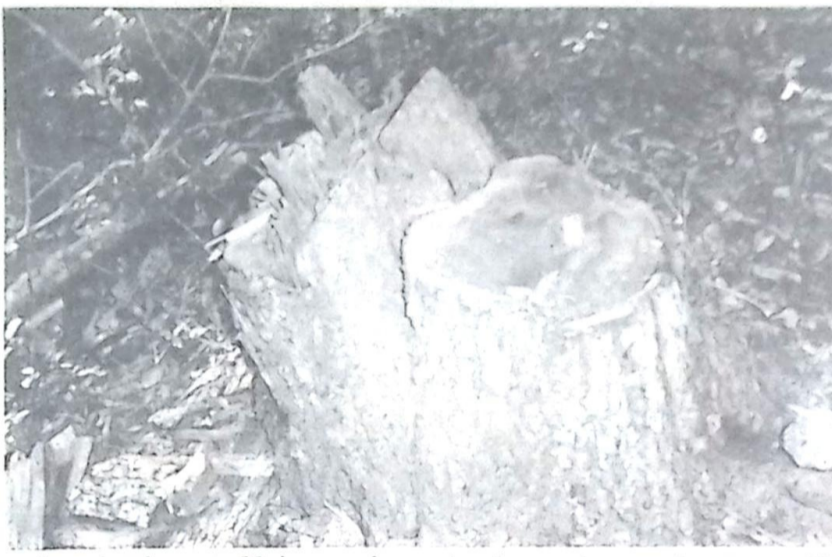
Aproximadamente 90 árvores de aroeira de grande porte foram extraídas irregularmente na Fazenda Serra Brava

Segundo as informações, após realizada a fiscalização e constatada a irregularidade, o proprietário da Fazenda não foi localizado e o capataz, ao ser indagado, afirmou não ter conhecimento da extração ilegal de aroeira na propriedade, a madeira não pode ser apreendida pelo fato da mesma já ter sido retirada e provavelmente comercializada.