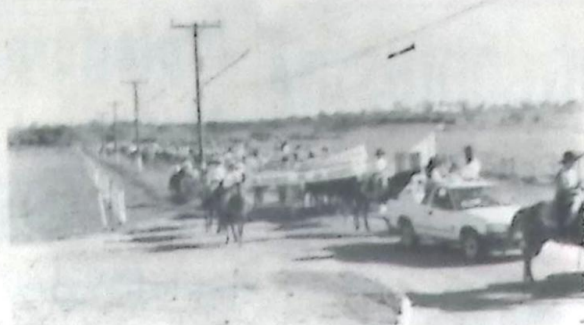
Um registro do bonito desfile Country que logo pela manhã saiu da cidade e foi até o Parque de Exposições