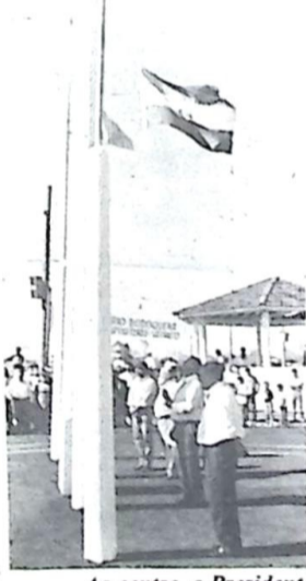
Ao centro, o Presidente Wasmosy faz o hasteamento da Bandeira Paraguaia