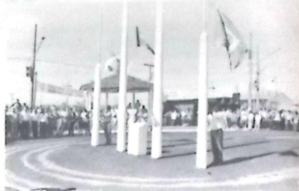
O Hasteamento dos Pavilhões marcou o início da solenidade de abertura oficial da Exposição

Ludio destacou a importância da EXPOBEL no contexto agropecuário do Estado e registrou sua confiança no setor produtivo rural, "apesar de muitos o acusarem de atrasado", disse ele e complementou: "se a nossa pecuária fosse atrasada nós não estaríamos fornecendo carne para toda a população brasileira a preços tão baratos". Ludio finalizou suas palavras agradecendo ao Presidente do Sindicato Rural de Bela Vista pelo convite para se fazer presente na abertura da 26ª EXPOBEL.