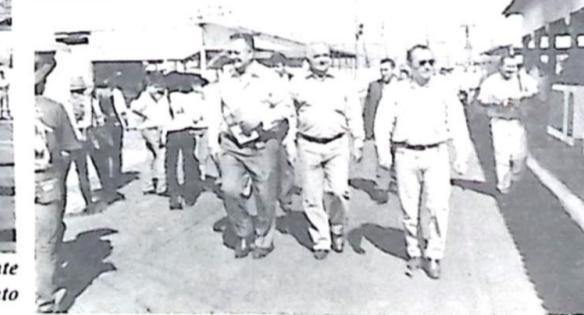
...passeou pelo Parque de Exposições Rio Apa