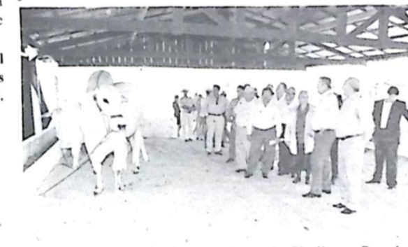
Acompanhado do Presidente do Sindicato Rural, o Presidente do Paraguai visitou os stands de exposição de gado Nelore e...