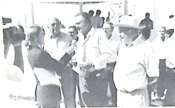
Presidente Juan Carlos Wasmosy, em entrevista à imprensa no Parque de Exposições

Após a solenidade de abertura oficial da 26ª EXPOBEL, o Presidente do Paraguai Juan Carlos Wasmosy falou à imprensa sobre o acordo entre o Brasil e o Paraguai, que será assinado hoje, dia 15, no Itamaraty, em Brasília, com vistas a criar uma legislação binacional para a fiscalização e combate à pesca predatória no Rio Paraguai, atividade que há alguns anos vêm sendo motivo de conflitos entre as autoridades brasileiras e pescadores paraguaios, exatamente pela inexistência de uma legislação mais adequada para a faixa de fronteira.