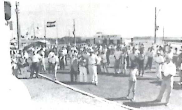
Bom público prestigiou a solenidade de abertura da Exposição