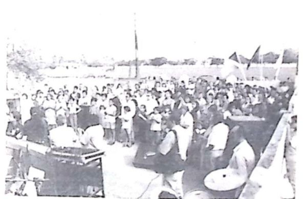
Centenas de pessoas prestigiaram a solenidade, em frente a Casa Paroquial