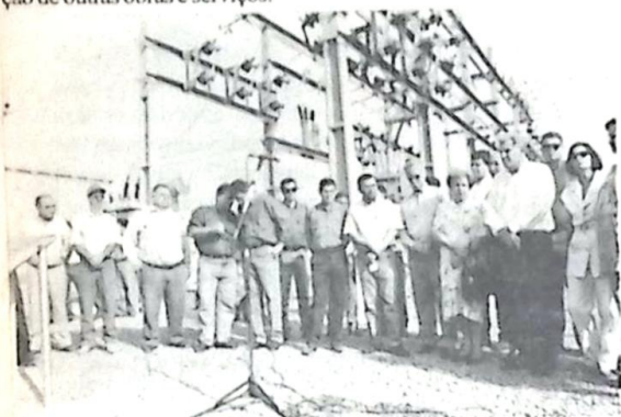
Diversas lideranças receberam o Governador em Bela Vista

O Governador Wilson Barbosa Martins, acompanhado da 1ª Dama e Presidente do Fundo de Promoção Social do Estado, Dona Nely Martins, dos Deputados Estaduais Waldemir Moka e Waldir Neves, de Secretários de Estados e Presidente de Órgãos e Autarquias do Governo, esteve em Bela Vista no último sábado, dia 02, onde inaugurou a nova Sub-Estação de energia elétrica e o Centro Social de Múltiplo Uso, na Vila Cohab, anunciou a conclusão da pavimentação asfáltica da BR 060, trecho Bela Vista/Jardim e também fez o lançamento oficial da pavimentação asfáltica da pista de pousos e decolagens do Aeroporto Municipal, além de assinar convênios com o Município para a execução de outras obras e serviços.