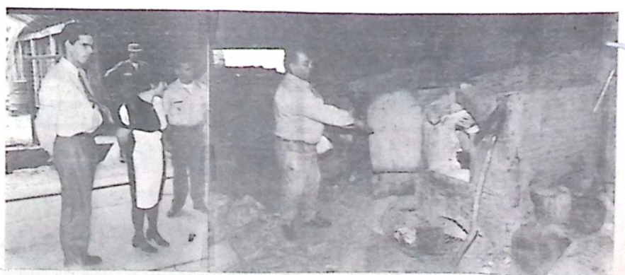
Flagrante da incineração da "erva" maldita