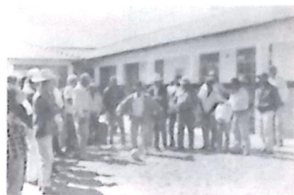
Muitas brincadeiras foram feitas e os vencedores ganharam prêmios: cobertores e outros. Jogo de bola, truco e muita prosa foi o que não faltou