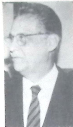
FHC anuncia o aumento ainda este ano

O Presidente destacou também a importância da vacina antitetânica como forma de reduzir o risco de mortalidade do recém-nascido e da própria mãe. Esse programa começou no Nordeste, mas hoje, segundo o Presidente, já está em 20 Estados, além do Distrito Federal. "Eu sei que os