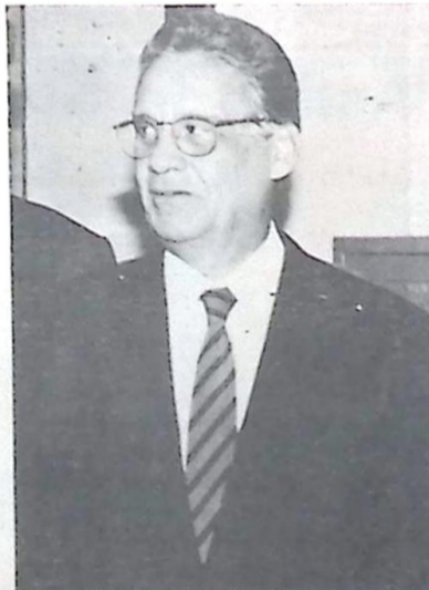
Presidente Fernando Henrique Cardoso

O Presidente Fernando Henrique Cardoso anuncia ainda este ano um aumento de recursos para os Municípios que aderirem ao Programa de Agentes Comunitários de Saúde. No programa semanal de rádio "Palavra do Presidente", Fernando Henrique afirmou que pretende formar 100 mil agentes comunitários até o final de 98. Também falou da Lei que inclui a laqueadura de trompas entre as cirurgias cobertas pelo Sistema Único de Saúde (SUS). Página - 03