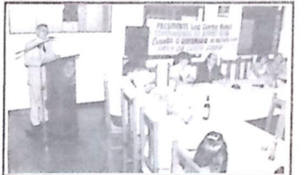
Flagrantes do jantar festivo