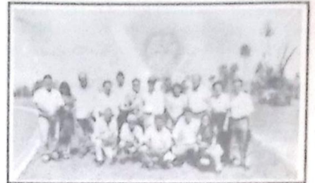
Rotarianos que foram recepcionar o Governador e sua esposa