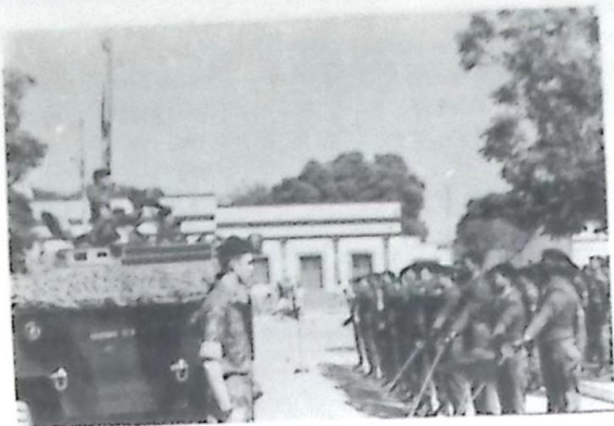
Alguns Fiagrantes da Comemoração do Dia do Soldado

O Cmt. do 10º RC Mec - RAJ, aproveita o ensejo para agradecer a população em geral pelo comparecimento à solenidade e, ao irrestrito apoio dos órgãos de comunicação locais (Rádio e Jornais).