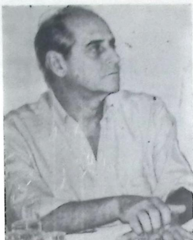
Senador Ramez Tebet

O Senador lembrou que o Brasil abriga a maior comunidade de descendência libanesa em todo o mundo e que seus emigrantes trouxeram o progresso e incentivaram o comércio e a