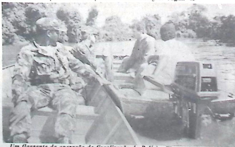
Um flagrante da operação de fiscalização da Polícia Florestal, no Rio Apa

foram abordadas seis embarcações e aproximadamente 50 pessoas, que efetuavam os mais diversos tipos de pesca, a grande maioria de forma legal, diga-se de passagem, as quais receberam orientação sobre como evitar a pesca predatória e as infrações às normas ambientais legais. Página - 05