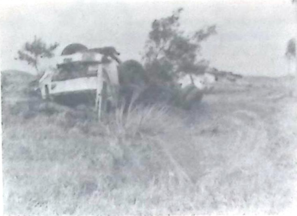
Nas fotos, flagrantes do violento acidente na BR-060, que teve como vítima fatal o condutor do Caminhão Tanque nhado ao Hospital São Vicente de Paula, em nossa cidade, para exame e posterior liberação pelo médico legista.

De acordo com os primeiros levantamentos realizados no local do acidente, que envolveu o caminhão tanque Ford Cargo 1680, placas HQR 0811 - Campo Grande, o condutor não se sabe os motivos, perdeu a direção do veículo, que saiu fora da estrada e chocou-se contra pelo menos três pés de coqueiro e outras árvores de grande porte, vindo a capotar. O caminhoneiro teve morte instantânea e ficou preso em meio as ferragens do caminhão, que ficaram bastante retorcidas devido a violência do impacto. Após o resgate, o corpo do caminhoneiro foi encami-