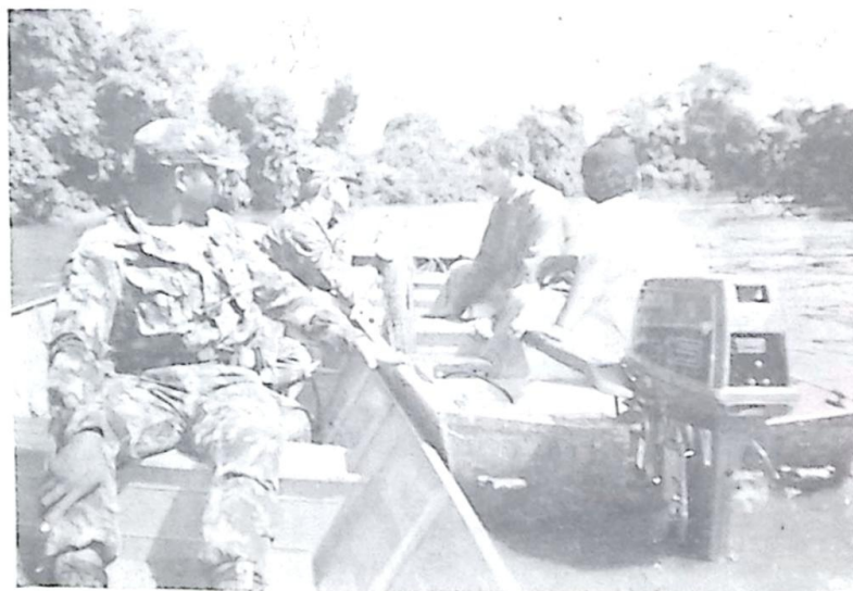
Um flagrante da operação de fiscalização da Polícia Florestal, no Rio Apa

Porém nas proximidades da Fazenda Friburgo, localizada às margens do Rio Apa, a guarnição da Polícia Militar Florestal abordou quatro elementos que praticavam pesca mediante a utilização de arma de fogo, sendo duas carabinas, uma calibre 38 e outra calibre 22, as quais foram sumariamente apreendidas. Na localidade de conhecida como pesqueiro do Paulão, os Florestais procederam uma rigorosa vistoria que resultou na apreensão de mais duas armas de fogo, dessa vez cartuchos calibre 36 e 40, as quais se encontravam escondidas no acampamento dos pescadores.