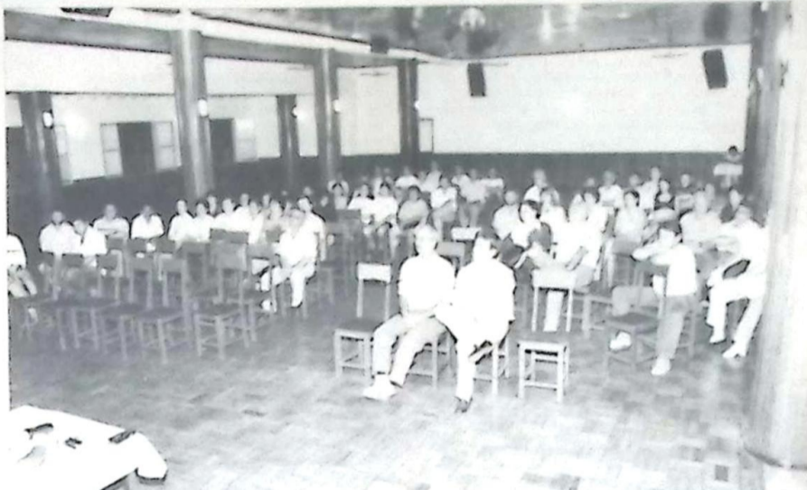
Um bom número de sócios da BHSVP prestigiou a Assembléia Geral Extraordinária no CEB