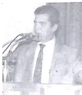
Deputado Waldir Neves

Agora, além de passe livre em ônibus urbanos e ter