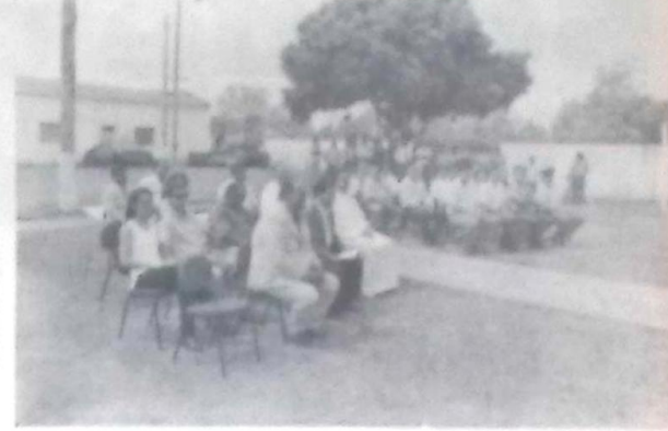
Autoridades, representantes de entidades e clubes de serviço prestigiaram a criação do COMEN

deverá destinar local apropriado para o desenvolvimento das atividades do órgão.