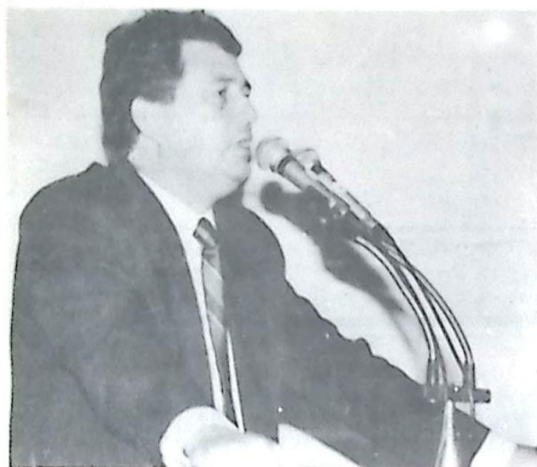
Deputado Estadual Waldemir Moka

O Deputado Waldemir Moka reafirmou na sessão do dia 08 a Assembléia Legislativa, a necessidade de o Governo Federal prestar auxílio financeiro para que o Governo do Estado resolva os problemas agrários que vem enfrentando. O Parlamentar rebateu críticas feitas pelo petista Ben-Hur Ferreira contra o Governador Wilson Martins e disse que no âmbito do Movimento dos Trabalhadores Sem-Terra (MST) "deve prevalecer o bom senso".