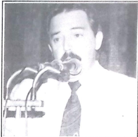
Deputado Estadual Antonio Carlos Arroyo

Mato Grosso do Sul está comemorando 20 anos. Já está para atingir a maioridade civil com uma personalidade própria e um potencial invejável, principalmente pela sua localização privilegiada o que torna um dos principais pontos de acesso aos Países do MERCOSUL.