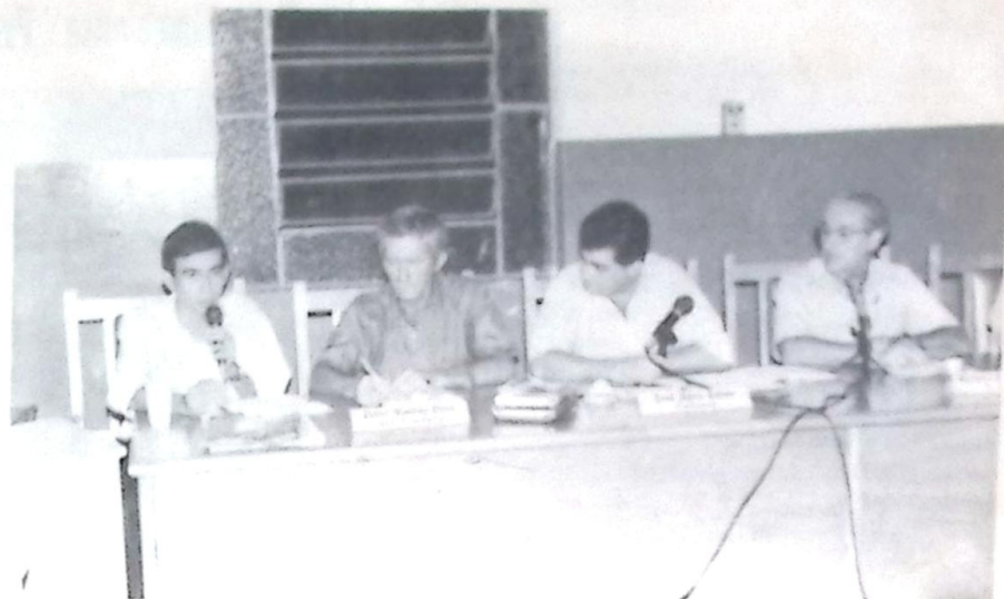
O Comandante da Polícia Militar prestou várias informações sobre o que diz a Legislação de Trânsito a respeito do serviço de Moto-Táxis

Para um melhor embasamento dos Vereadores, que provavelmente terão de legislar sobre o assunto brevemente, o oficial PM entregou uma cópia da Lei nº 2.152, do Município de Dourados, de 10 de setembro deste ano, que regulamenta o funcionamento do serviço de Moto-Táxis naquela cidade. De acordo com essa Lei, a autorização da prestação do serviço é concedida de forma individual, ou seja, di-