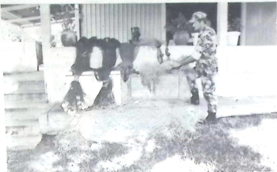
Os petrechos de pesca de grande porte, apreendidos pela Florestal em pleno período de Piracema

Na semana anterior Policiais daquela unidade apreenderam no Município de Caracol nada menos que 250 quilos de peixes das espécies pintado e pacú, retirados ilegalmente do Rio Apa, além de uma grande quantidade de petrechos de pesca cuja utilização é proibida nos rios de Mato Grosso do Sul. Esta semana, em pleno período da Piracema, uma Guarnição do Destacamento voltou a apreender diversos petrechos de pesca proibidos em um pesqueiro localizado na confluência dos rios Apa e Caracol, Município de Bela Vista. Os materiais foram abandonados pelos pescadores ao perceberem