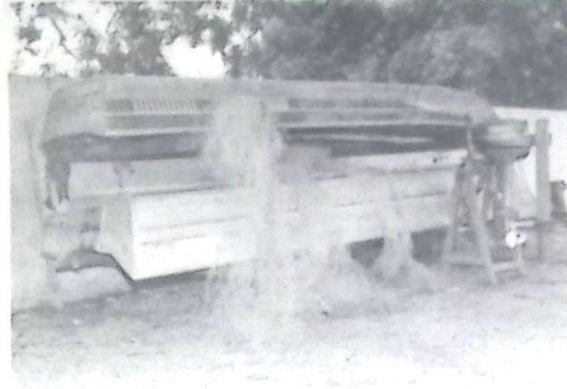
A frente dos barcos, as tarrafas apreendidas em poder do pescador que tentou escapar da Florestal