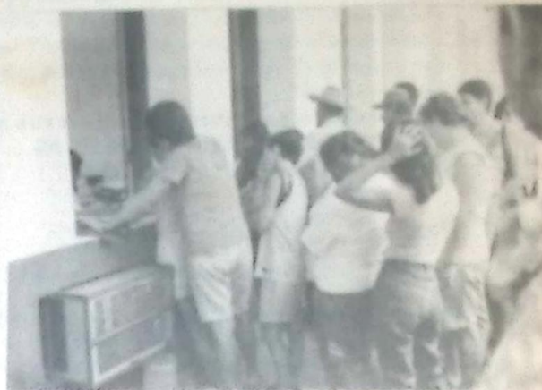
Funcionários recebendo o 13º salário, foto inédita na municipalidade

Para muitos funcionários o pagamento do 13º salário e da primeira e segunda etapa de salário de dezembro e a certeza de que o Prefeito José Garibaldi demonstra a sua seriedade e honestidade com o trato do dinheiro público, procurando sempre garantir o salário do funcionalismo, visto que hoje um dia não é todas as Prefeituras que prezam por isso.