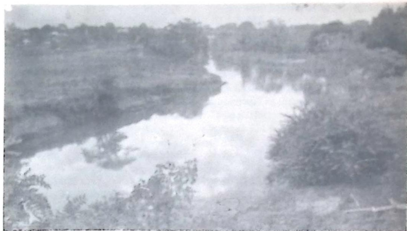
Vista do Rio Apa, cuja poluição do esgoto é cada vez mais intensa

Fica o alerta às nossas autoridades, aos nossos representantes na Assembléia Legislativa do Estado e no Congresso Nacional (leia-se Deputados Federais e Senadores), o nosso Rio Apa vêm sendo a cada dia mais e mais degradado, graças a poluição que recebe através do despejo de esgotos e, se nada for feito a curto prazo, a tendência é o rio morrendo aos poucos, pois a densidade populacional dos dois lados da fronteira tende a aumentar ano a ano, aumentando também a quantidade de poluição nele despejada. Talvez essa seja