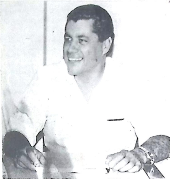
André Puccinelli, Prefeito de Campo Grande

Há muitos interesses em jogo (no Estado) neste tempo de globalização e de privatizações, muitas fronteiras à conquistar, o potencial turístico está aí, grandes grupos interessados em investir no Estado. Sim o italiano é o candidato ideal, está com a força, entusiasmado e sabe como ninguém enfrentar paradas