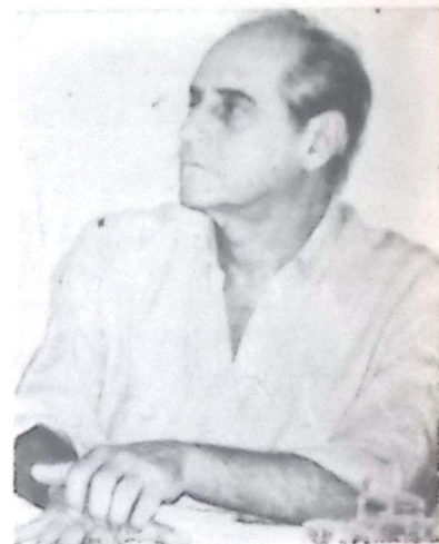
Senador Ramez Tebet

Lembrando que o Brasil tem 25 mil quilômetros de rios navegáveis, a metade da extensão da rede rodoviária federal, o senador disse que o mais barato caminho para a nossa agricultura é o hidroviário. E afirmou que, nos Estados Unidos, maior produtor mundial de soja, 70% da