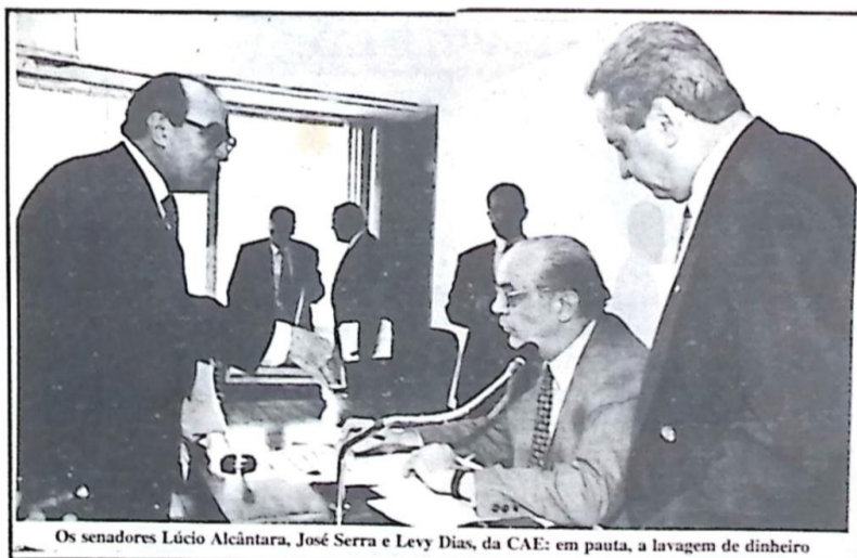
Os senadores Lúcio Alcântara, José Serra e Levy Dias, da CAE: em pauta, a lavagem de dinheiro

A Comissão de Assuntos Econômicos aprovou esta semana o Parecer do Senador Levy Dias (PPB-MS) favorável ao Projeto de Lei de iniciativa do Executivo, já votado na Câmara, que fixa penas para os crimes de lavagem de