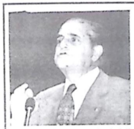
Tebet: "Critérios para a demissão"

Segundo o senador, a proposta em discussão no plenário do Senado reafirma a necessidade de concurso para ingresso no serviço público e estabelece critérios para a demissão de funcionários. No