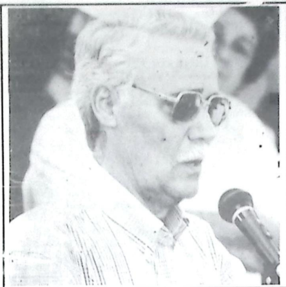
Governador Wilson Barbosa Martins

Para Wilson e os demais governadores do PMDB, a intenção da nota é antecipar aos peemedebistas a postura que irão defender na convenção nacional do partido, marcada para o dia 8 de Março. O documento foi divulgado logo após o ex-presidente Itamar Franco