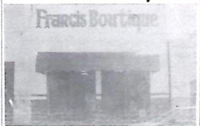
Chegando em Jardim, faça suas compras na Francis Boutique, onde você encontra de tudo para homens, mulheres e crianças. Os preços são de tirar o chapéu!