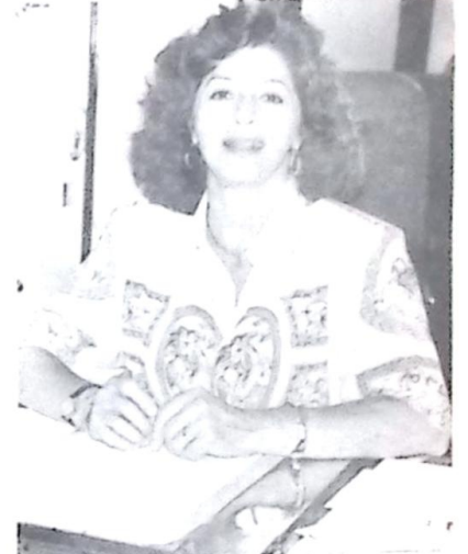
Deputada defende candidatura do senador ao governo completado. Por isso, precisamos da confiança popular, com a certeza de que a continuidade do trabalho vai garantir o alcance desses objetivos máximos".