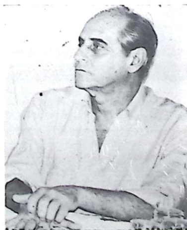
Senador Ramez Tebet

Em sua opinião, cabe agora ao poder executivo fazer tudo que estiver a seu alcance para colocar em operação as normas aprovadas pelo Legislativo. Lembrando que o Presidente da República cobrava do Legislativo as reformas sujeitas à deliberação do Congresso, o senador afirmou: "agora, o presidente as tem todas, incluindo a reforma econômica, a administrativa e a da previdência. Ficam faltando as reformas tri-