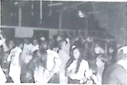
Empolgação total dos jovens presentes