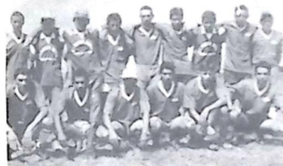
A equipe da Fazenda Carandá jogou à altura, mas faltou um pouco de sorte

Registramos aqui a disciplina dos atletas que mostraram um futebol de alto nível.