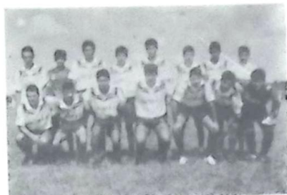
O segundo lugar ficou para o time União da Vila, da Vila Souza, que mostraram muita garra e determinação