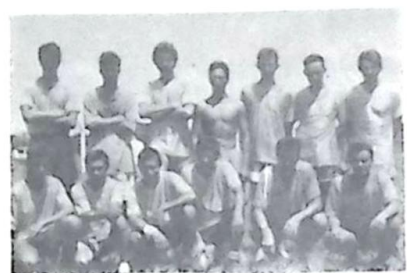
O time da Vila Guilhermina mostrou um bonito espetáculo ao público e promete voltar com tudo no próximo domingo, com o apoio da Mity Propaganda