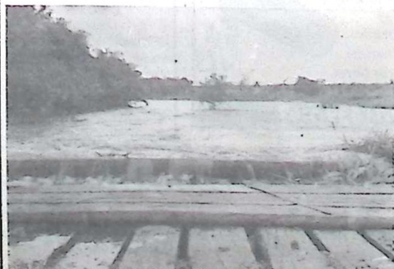
Ponte de entrada da cidade, sendo coberta pelas águas do Córrego Porteira