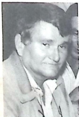
Deputado Zeca do PT

Dando continuidade a projeto desenvolvido pelo Partido dos Trabalhadores, de abrangência estadual, as duas primeiras etapas já realizadas no Bolsão e em Ponta Porã, o Deputado Zeca do PT viaja nesta quinta-feira, dia 02 de abril para a Região Sudoeste, onde em cinco Municípios, em Plenárias Populares discutirá com os sulmatogrossenses a conjuntura sócio-política e econômica local e um novo programa de desenvolvimento para o Estado.