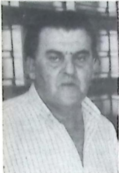
Deputado Hosne Esgaib