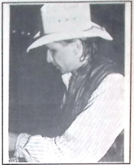
mais famoso do Brasil, o Asa Branca (foto), estará fazendo seu show na EXPOBEL em julho, narrando os Rodeios que lá serão realizados.