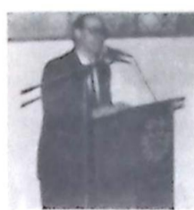
Governador do Rotary Club

Você vai viver três dias emocionantes. Imperdível!!