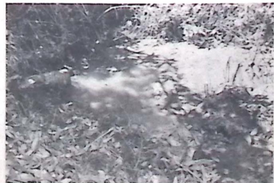
O esgoto é despejado em uma vala, a poucos metros das residências do Conjunto

Naquela época, o esgoto residencial da Vila, com todo tipo de dejetos, apresentava vazamento em alguns pontos da rede coletora e outra parte era despejado nas proximidades do Centro Comunitário do Conjunto, onde se acumulava nas depressões do terreno, a poucos metros das residências, causando