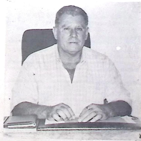
Prefeito José Garibaldi da Rosa Neto

Ativou e implantou com eficiência todos os programas preventivos, contratou profissionais habilitados em áreas específicas como fisioterapia, laboratorista, bioquímica, enfermeira padrão, além da competente equipe médica. Página - 07