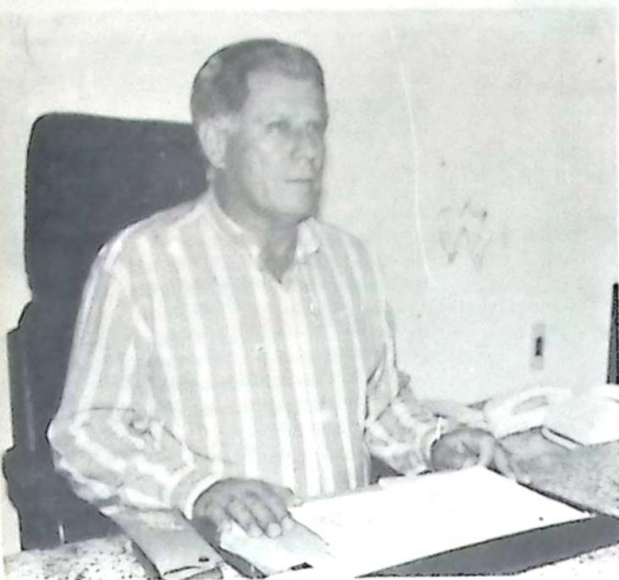
Prefeito Municipal José Garibaldi da Rosa Neto

O Prefeito José Garibaldi da Rosa Neto falou nesta semana, à imprensa que "um problema crônico de Bela Vista estará sendo sanado com o funcionamento efetivo de parte da rede coletora de esgoto.