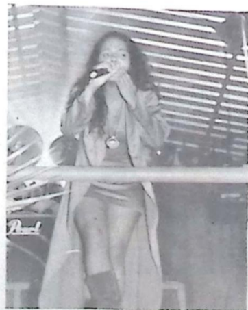
A simpática e encantadora vocalista da Banda Uns e Outros, que recentemente esteve agitando a galera jovem de Bela Vista, numa homenagem ao Dia das Mães, do Supermercado Arco Íris