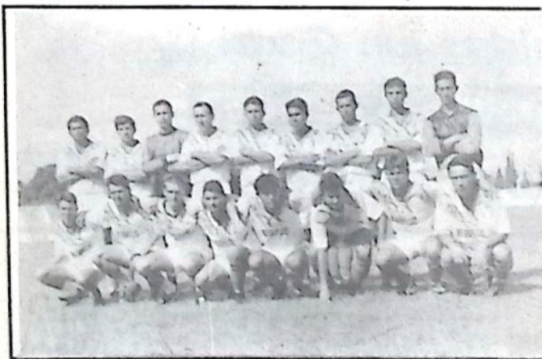
Caracol Futebol Clube