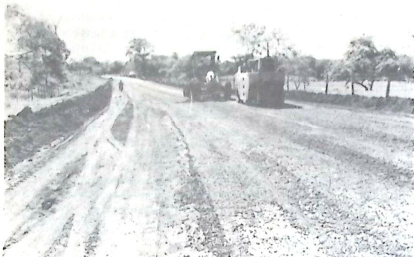
Com a execução das obras a Avenida de acesso ao Parque de Exposições será totalmente revitalizada