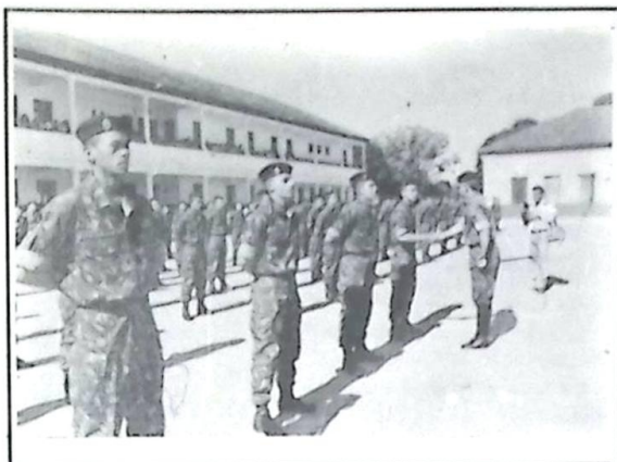
O Comandante do Regimento cumprimentando os Soldados destaques

Após criteriosa avaliação os conscritos que obtiveram os melhores desempenhos