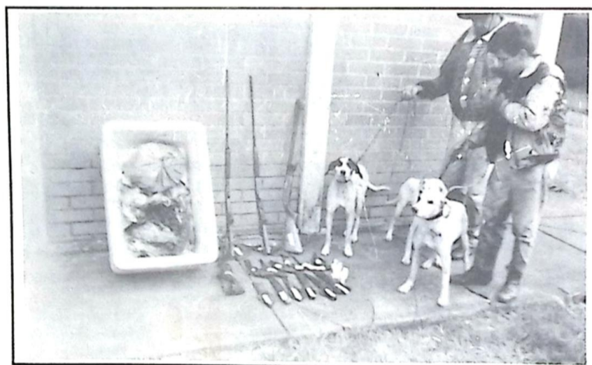
Registra das várias armas brancas e de fogo apreendidas com os caçadores, que também se utilizavam de três cachorros

No último dia 1º, na Rodovia MS 384, que liga Bela Vista à Antonio João, a Polícia Militar Florestal da nossa cidade flagrou seis elementos que praticavam caça na região, os quais portavam armas brancas e de fogo e se utilizavam de pelo menos três cachorros para perseguir e abater animais silvestres, prática que é totalmente proibida pela Legislação Ambiental.