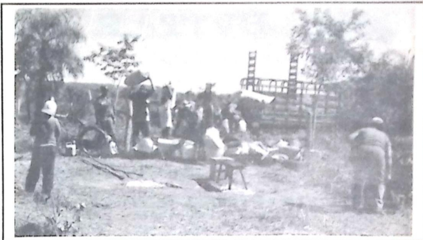
Momento em que os sem-terras carregavam seus pertences em um caminhão, para deixarem a área invadida