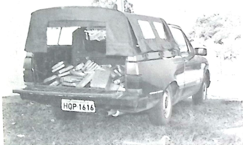
Flagrante do veículo com fundo falso abarrotado da erva maldita

Na madrugada do último domingo, dia 14, por volta das 05:25 horas, uma guarnição da Polícia Militar de Bela Vista, que realizava ronda de rotina, efetuou a apreensão de aproximadamente 75 quilos da substância entorpecente cannabis sativa,