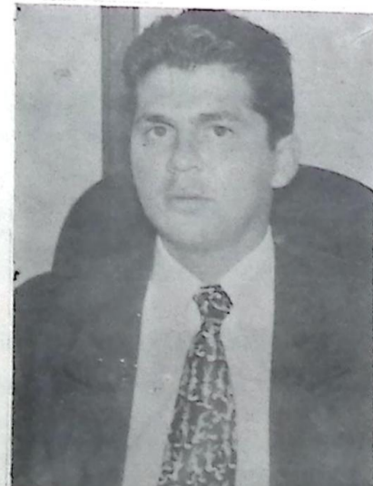
Deputado Waldir Neves