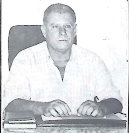
Prefeito de Bela Vista José Garibaldi