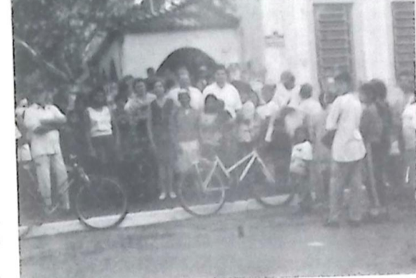
O Prefeito e a 1ª Dama juntamente com os beneficiários pela Secretaria de Assistência Social