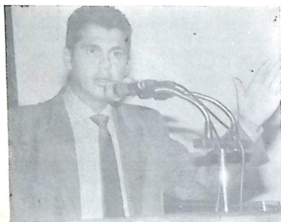
Deputado Waldir Neves

O Deputado Waldir Neves, líder do PSDB na Assembléia Legislativa, ao comemorar a entrega de viaturas para a Polícia Militar de diversos municípios, destacou os esforços do governo para melhorar o setor de segurança pública. Ao considerar que a criminalidade hoje é um flagelo contra a cidadania, Waldir Neves frisou que a administração estadual está tentando melhorar o setor com a contratação de 1.288 novos policiais, aumentando o efetivo em 30%, além de ter criado três quartéis desde 1996 e dispor de um plano de investimentos que vem construindo e reformando os destacamentos e equipando a corporação.