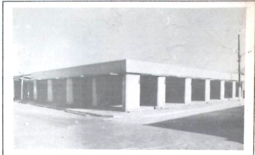
Vista do Mini-Shopping construído no Parque de Exposições Rio Apa, que vai oferecer maior conforto e comodidade à lojistas e clientes

O Sindicato Rural de Bela Vista concluiu esta semana a construção de um belíssimo Mini-Shopping no Parque de Exposições Rio Apa, em frente ao Restaurante da EXPOBEL, local nobre e de grande movimento, por onde cruzam a maioria das pessoas que chegam ou saem do recinto da EXPOBEL.